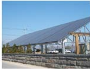
[강원 춘천 30kW급 태양광발전]