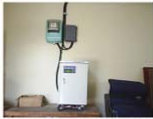
[경남 함안 3kW급 태양광주택]